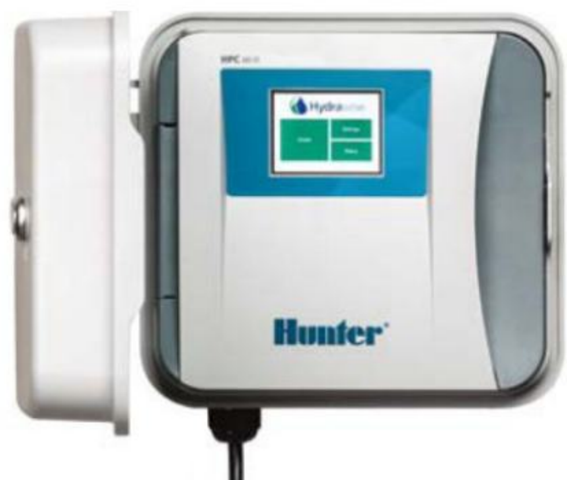
مشخصات ظاهری کنترلر مدل HPC

بدنه پلاستیکی ارتفاع : ۲۲.۹ سانتیمتر عرض : ۲۵.۴ سانتیمتر عمق : ۱۱ سانتیمتر