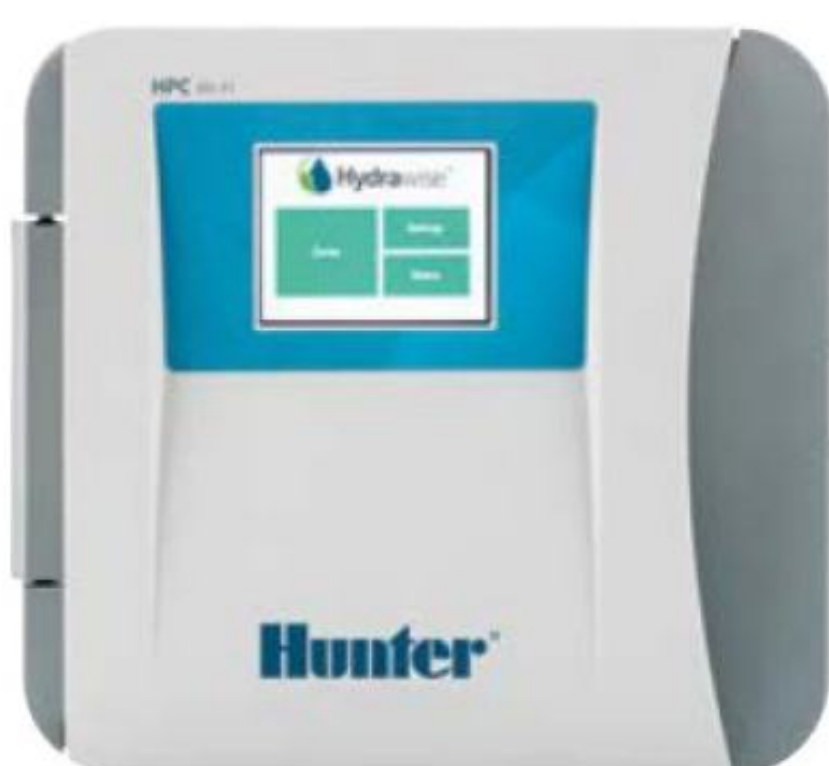
ظاهر کنترلر مدل HPC

بدنه پلاستیکی ارتفاع : ۲۲.۹ سانتیمتر عرض : ۲۵.۴ سانتیمتر عمق : ۱۱ سانتیمتر