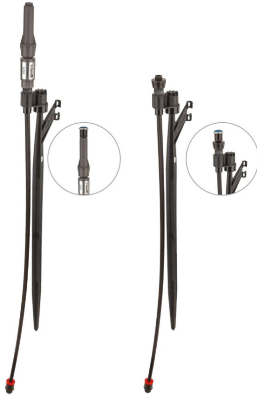
ارتفاع کل: ۸۶ سانتی متر اتصال نری دنده ای ۱/۲ اینچ