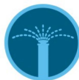
همه نازل های MP ROTATOR