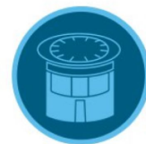
نازل های آبیاری