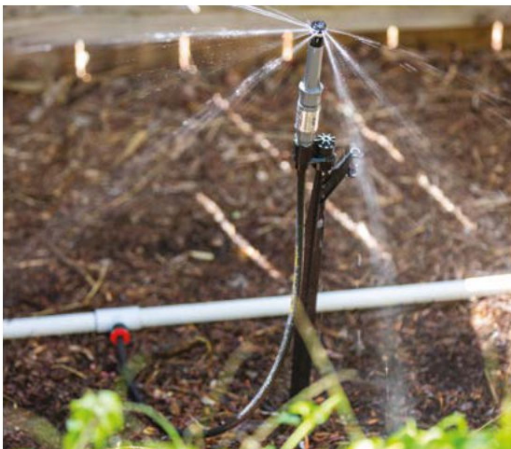
MP-STAKE-PSR40-CV در وضعیت نصب شده